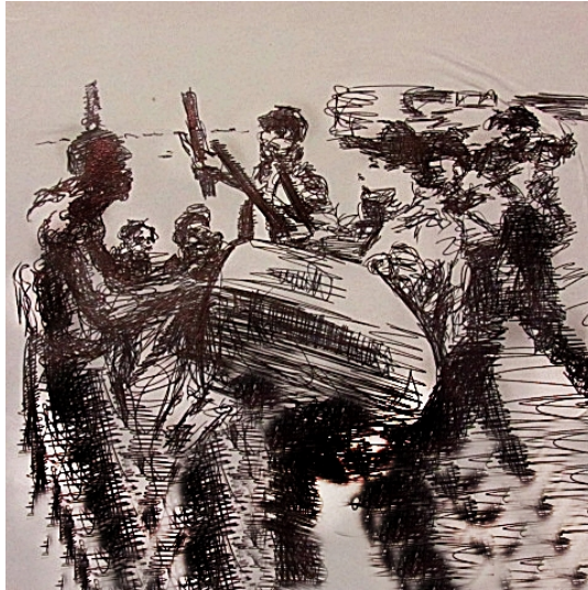
Ilustração de Marlon Anjos